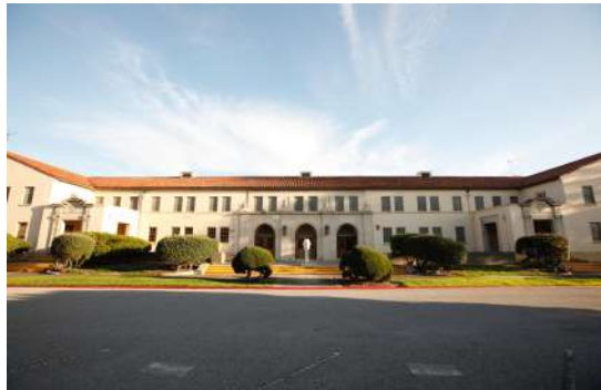
Das Hauptquartier der SU im Silicon Valley, USA.