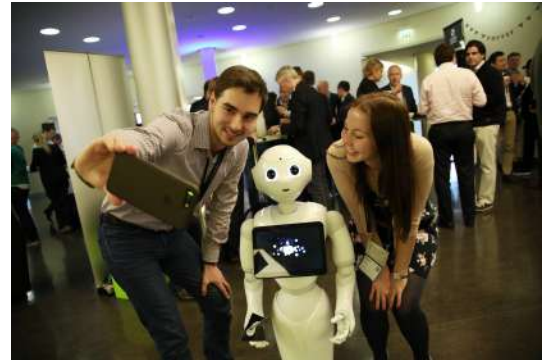
Rückblick auf den SingularityU Germany Summit, 2017

Der SingularityU Germany Summit bietet in diesem Jahr neben zahlreichen Vorträgen und Keynotes auch interaktive Formate und Workshops. So wird dem „Erleben“ von Technologien wichtiger Raum gegeben.