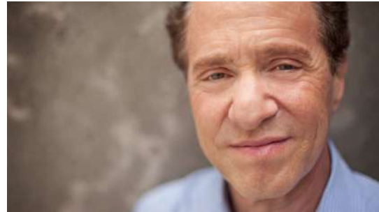
Ray Kurzweil, Technischer Leiter Google; Co-Founder der Singularity University